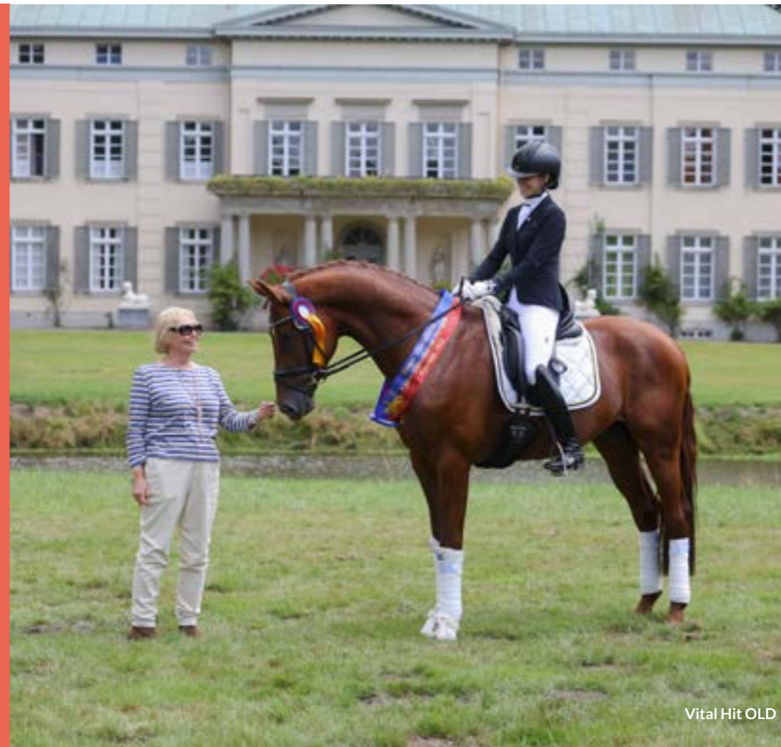
Vital Hit OLD

Internationales Festhallen Reitturnier Frankfurt, Frankfurt am Main